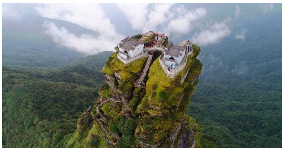
（图为贵州梵净山金顶）

2018 年世界遗产一度成为网络热门词汇。先是梵净山被成功列入《世界遗产名录》，后又传来北京中轴线申遗已确定 14 处遗产点的消息。2019 年 7 月第 43 届世界遗产大会落下帷幕。中国黄（渤）海候鸟栖息地和中国良渚古城遗址在会上先后通过审议，被列入世界遗产名录。如果你是旅游达人，一定在许多景区都看到过世界遗产的石碑。那么，你对我国拥有的世界遗产了解多少呢？